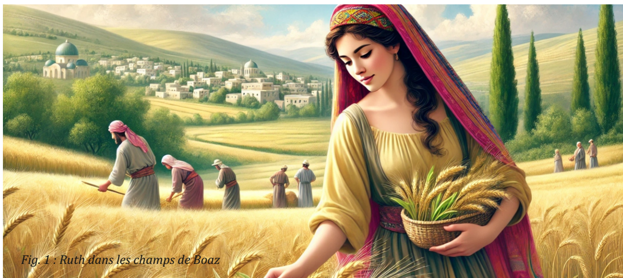
Fig. 1 : Ruth dans les champs de Boaz

L'apôtre Paul peut aussi s'identifier à un service dans des circonstances défavorables : « Vous savez de quelle manière je me suis toujours conduit avec vous, depuis le premier jour où je suis arrivé en Asie, servant le Seigneur en toute humilité, avec larmes et au milieu des épreuves que me suscitaient les embûches des Juifs [...] Mais je ne fais pour moi-même aucun cas de ma vie, comme si elle m'était précieuse, pourvu que j'accomplisse ma course avec joie, et le