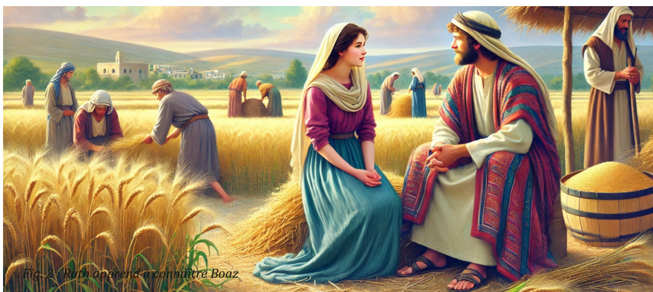
Fig. 2 | Ruth apprend à connaître Boaz

Après un travail inlassable accompli, fais confiance à Dieu et repose-toi en lui. Naomi dit à Ruth : « Reste ici, ma fille, jusqu'à ce que tu saches comment l'affaire tournera ; car cet homme (Boaz) ne se