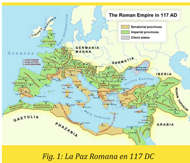
Fig. 1: La Paz Romana en 117 DC

- El mensaje del reino de Jesucristo debe ser predicado a TODAS las naciones de toda la tierra habitada. Todos deben escuchar el Evangelio como testimonio (v. 14a; Mc 13.10).- Solo entonces vendrá el fin (Mt 24.14b).