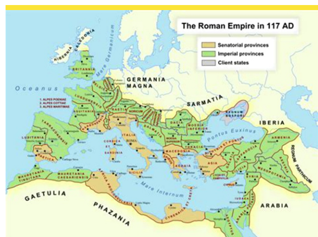
Fig. 1: La Pax Romana en 117 après JC

- Ce n'est qu'alors que viendra la fin (Mt 24.14b).