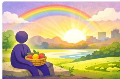
Zur Vollendung in Gottes Ruhe

Methodischer Hinweis: Ausgelegt wird primär Genesis 1,1–2,3, punktuell unter Einbezug von Genesis 2. Die Bibelstellen werden grundsätzlich nach der Elberfelder Bibel (ELB) wiedergegeben; andere Übersetzungen werden nur dort ergänzend beigezogen, wo sie semantische Nuancen verdeutlichen. Die vorliegende Analyse unterscheidet zwischen Exegese, heilsgeschichtlicher Entfaltung, christologischem Höhepunkt und praktischer Anwendung, damit die Übertragung auf das Christenleben theologisch anwendbar bleibt.